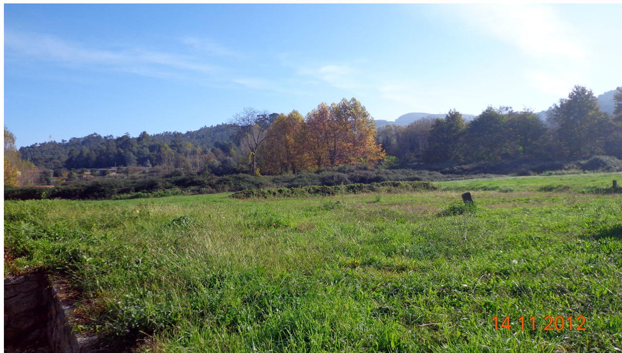
Foto da Entrada Principal para o Terreno onde vai ser implantado o Centro Social

Foto do Terreno para a Implantação do Centro Social