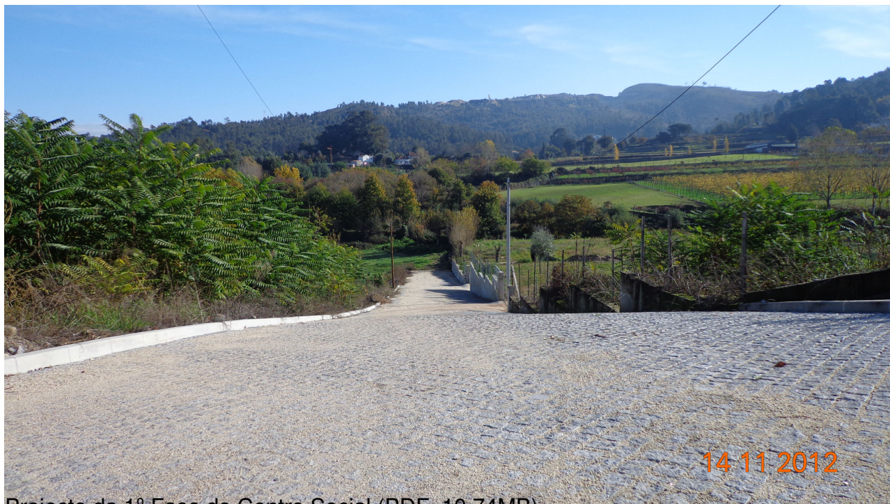
Projecto da 1ª Fase do Centro Social (PDF: 10.74MB)